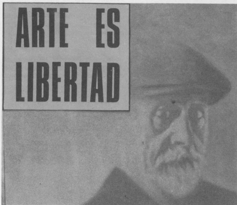
Un retrato de Pablo Iglesias, fundador de nuestro partido, preside, junto a un Cuixart, la exposición organizada por el PSOE, en el Congreso, en la que participan firmas populares.